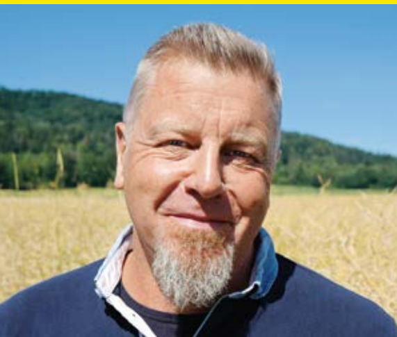
Luginbühl Fahrzeugtechnik AG 40 années passionnantes

Depuis plus de 40 ans, nous nous sommes engagés avec nos collaborateurs, nos produits et nos services sur l'ensemble du marché de la mobilité. Je me réjouis que tant de clients, tant de fournisseurs et un nombre impressionnant de collaborateurs nous aient suivis aussi fidèlement au cours de toutes ces années. Notre devise «Votre rentabilité est notre moteur» est plus que jamais d'actualité et nous engage chaque jour.