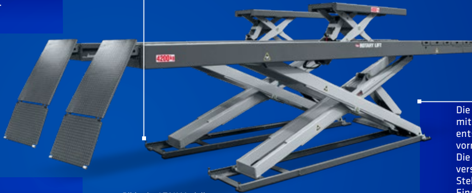
Bild zeigt LTAK Modell, Bodenaufliedend mit Auffahrampen

Das Bedienpult besitzt ein werkseitig vormontiertes, mit der Hebebühne verbundenes Hydraulikaggregat und trägt damit maßgeblich zu einem geringen Installationsaufwand bei. Die Platzierung ist links oder rechts möglich.