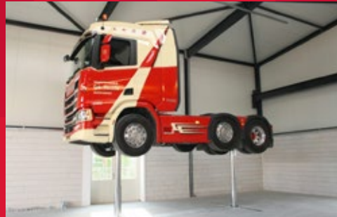
Stempelanlage mit min. einem festen und einem querverfahrbaren Hubstempel