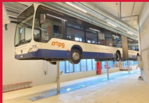
Mehrstempelanlage ideal für lange Fahrzeuge