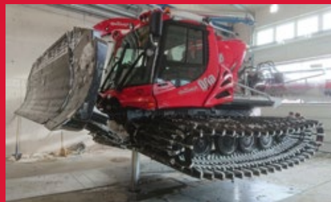
Optionale Aufnahmen für Sonderfahrzeuge