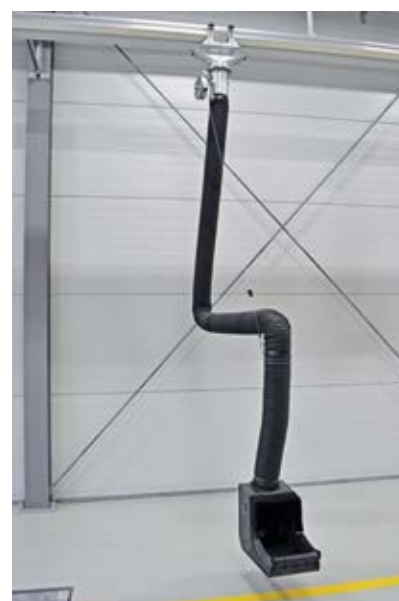
Bild links: Slift-4-Stempelbühne Bild oben: s.tec-Untenabsaugarm Bild rechts: s.tec-Absaugkanal