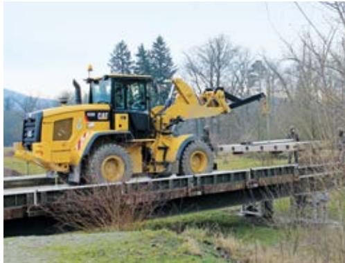
armasuisse Radlader CAT 930K

« Strenge Beschaffungskriterien erfüllt »