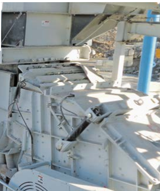
Stationäre Brecheranlage mit 129 Schmierstellen