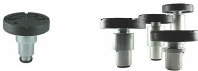
Tragteller PZ-GT45 und Tragteller-Satz PZ-GTSP